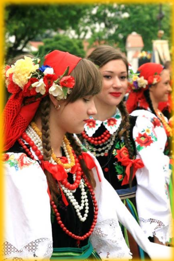
Obchody Bożego Ciała w Łowiczu 2013

ウィーンからお迎えするメゾソプラノ & 日野妙果さんのソロ 特別編曲の歌曲合唱（レクチャー付き）